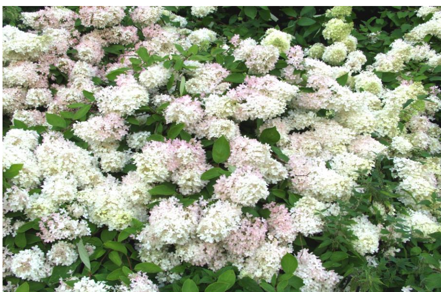
Sysshortensia - Hydrangea paniculata 'Grandiflora'